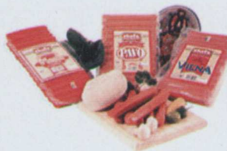
Fig. 4, 5 y 6. Con películas y/o recubrimientos comestibles.