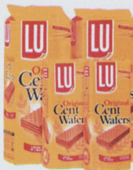
Fig. 1. Envases de fácil apertura y resellables.

Los métodos tradicionales de conservación destruyen o inactivan enzimas y microorganismos patógenos, los cuales pueden ser tratamientos físicos como: Térmicos, desecación, congelación y refrigeración, o bien tratamientos químicos y biológicos como la adición de conservadores y otros aditivos